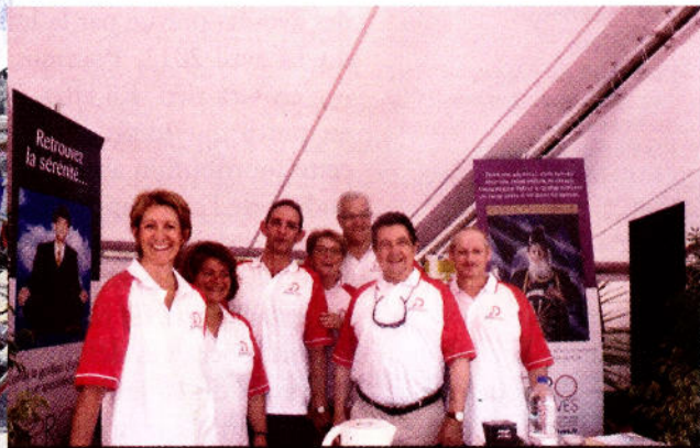
L'équipe de Jurisdéfi, association interprofessionnelle, qui fêtait sa première régates à la Juris'cup